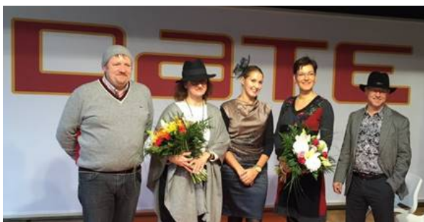
Foto von der DATE Pressekonferenz am 24.11.2015

Weitere Informationen unter: www.deutschesmodeinstitut.de