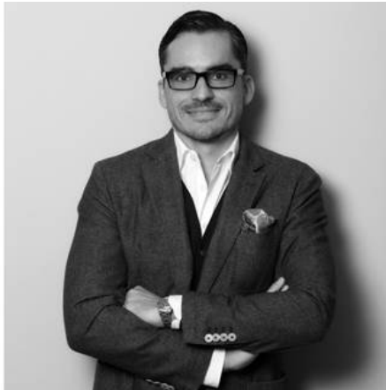
Jochen Hinkel

Bitte akkreditieren Sie sich unter: 0039Italy@textschwester.de