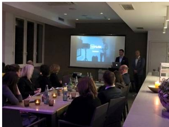
Entwerfer: @Fashion Net

Weitere Informationen unter: http://www.fashion-net-duesseldorf.de