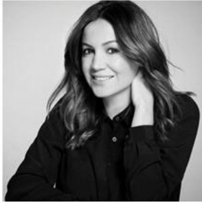
Aysen Bitzer